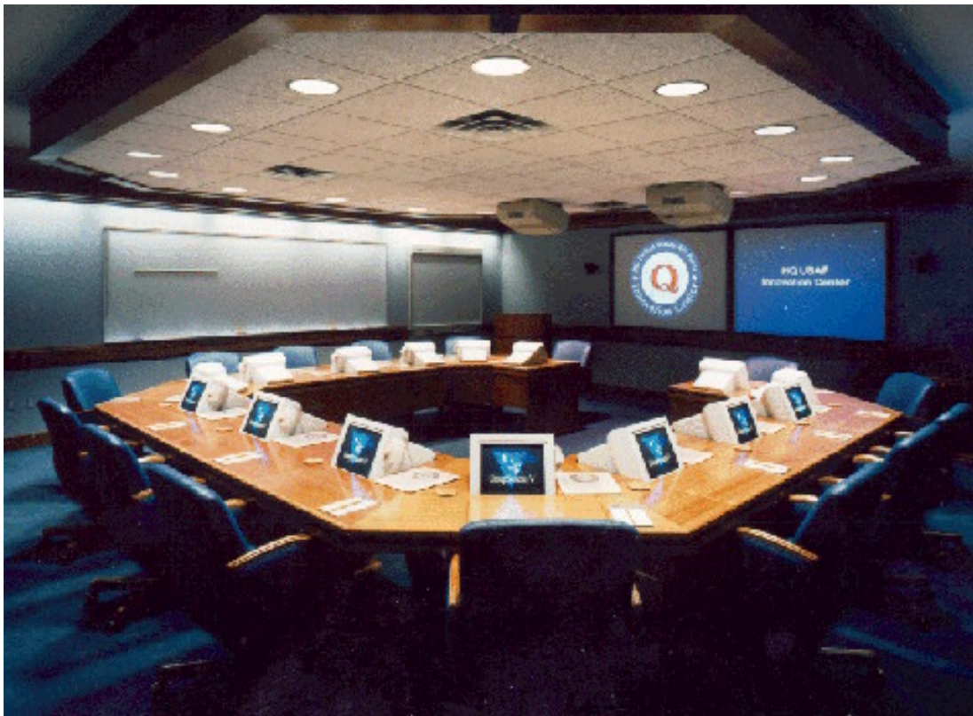
US Air Force