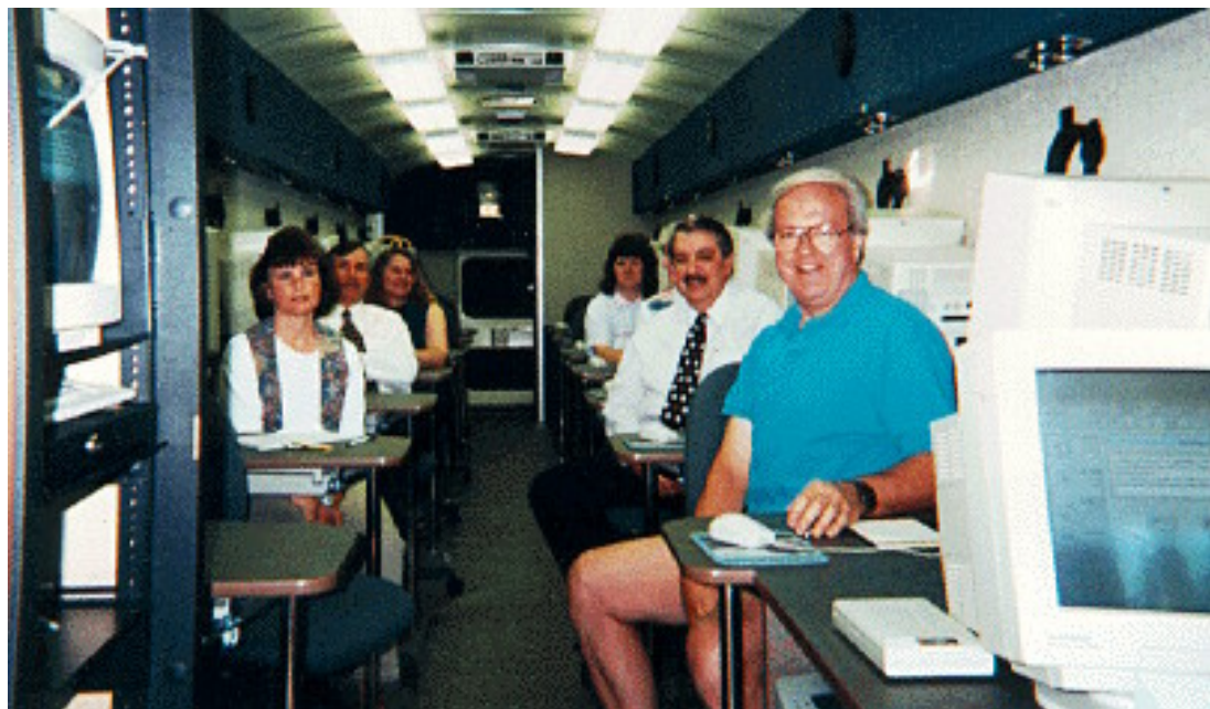
Murraysville School District Bus